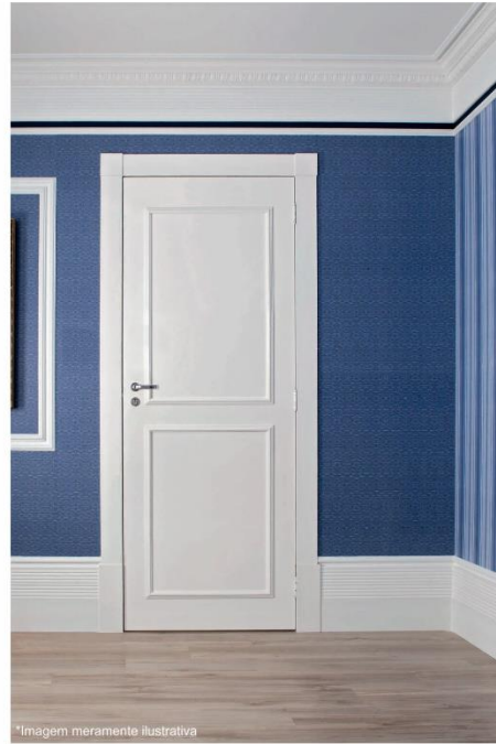
Arq. Josiane Flores - Foto / Photo: Robson Caichoeira